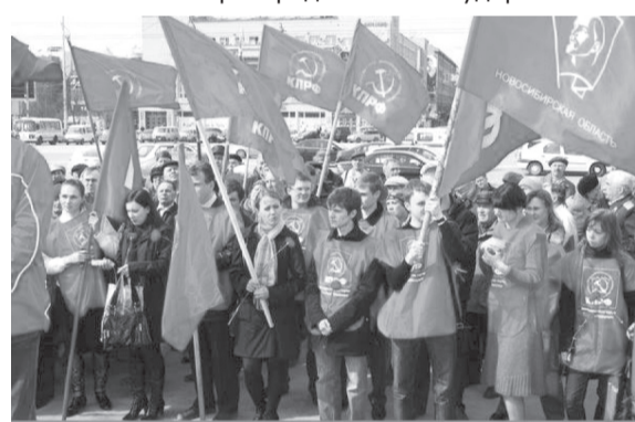
Молодежь против повышения пенсионного возраста!

Всеми силами пытаюсь сохранить существующее общественно-экономическое устройство, буржуазное правительство в очередной раз предпочитает решать собственные проблемы за счет наиболее уязвимых слоев населения. Вместо развития производительных сил, национализации тяжелой и добывающей промышленности, равномерного распределения государственных