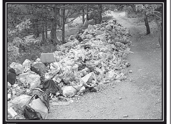
Природа уже начала жалеть что создала человека

Несколько лет назад вдобавок к коррупцированным и бездействию экологическим структурам создана ещё одна надстройка – Департамент Федерального службы по надзору в сфере природопользования по СКФО.