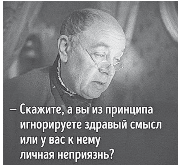
– Скажите, а вы из принципа игнорируете здравый смысл или у вас к нему личная неприязнь?