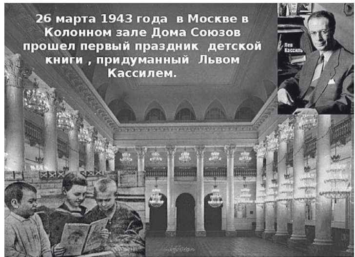
26 марта 1943 года в Колонном зале Дома Союзов прошёл первый праздник детской книги, придуманный Львом Кассилем.

О чём думала, заботилась Советская власть в далёком и тяжёлом 1943 году, 75 лет назад? Чем был занят товарищ Сталин?