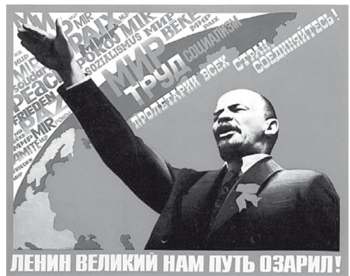
ЛЕНИН ВЕЛИКИ НАМ ПУТЬ ОЗАРИЛ!

Говорят, что ленинизм давно устарел. Но разве капитализм устарел? Разве нет больше частной собственности, олигархии, конкурен-