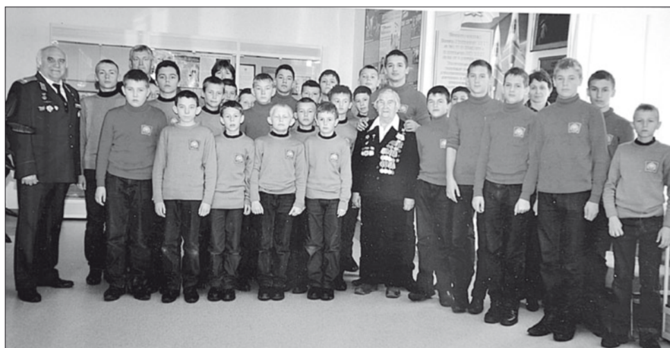
Встреча с воспитанниками Севастопольского ПКУ в Ставропольском президентском кадетском училище