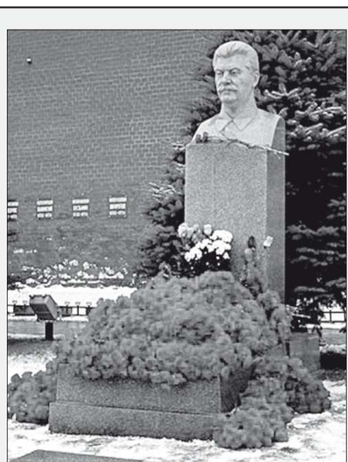
5 марта исполнилось 65 лет со дня смерти И.В. Сталина – великого государственного деятеля XX века

внимания. Спасибо за Ваш вклад в наше общее дело.