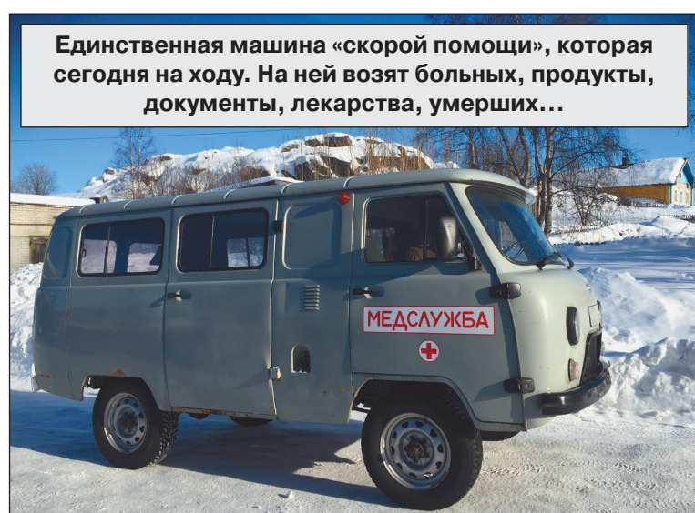
Единственная машина «скорой помощи», которая сегодня на ходу. На ней возят больных, продукты, документы, лекарства, умерших...

«Кандалакшская ЦРБ» обременена присоединением районных больниц, удалённых на более чем за 100 км от лечебного