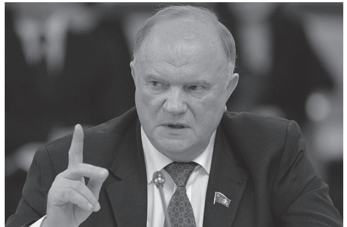
Великолепные соорудя палаты, где разливаются в пирах

Где, укажите нам, отечества отцы, Которых мы должны принять за образцы? Не эти ли, грабительством богаты? Защиту от суда в друзьях нашли, в родстве,