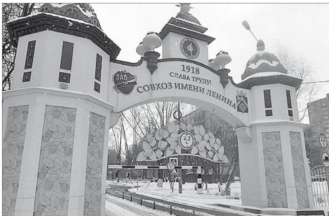
детсад! 1,7 миллиарда рублей, говорят, совхоз на них потра-

тил! – А вон в той многоэтажке сам Грудинин живёт! – продолжают беседовать. – Не в особняке. На одном этаже с обычным трактористом. Без охраны гуляет тут по улицам, со всеми здоровается.