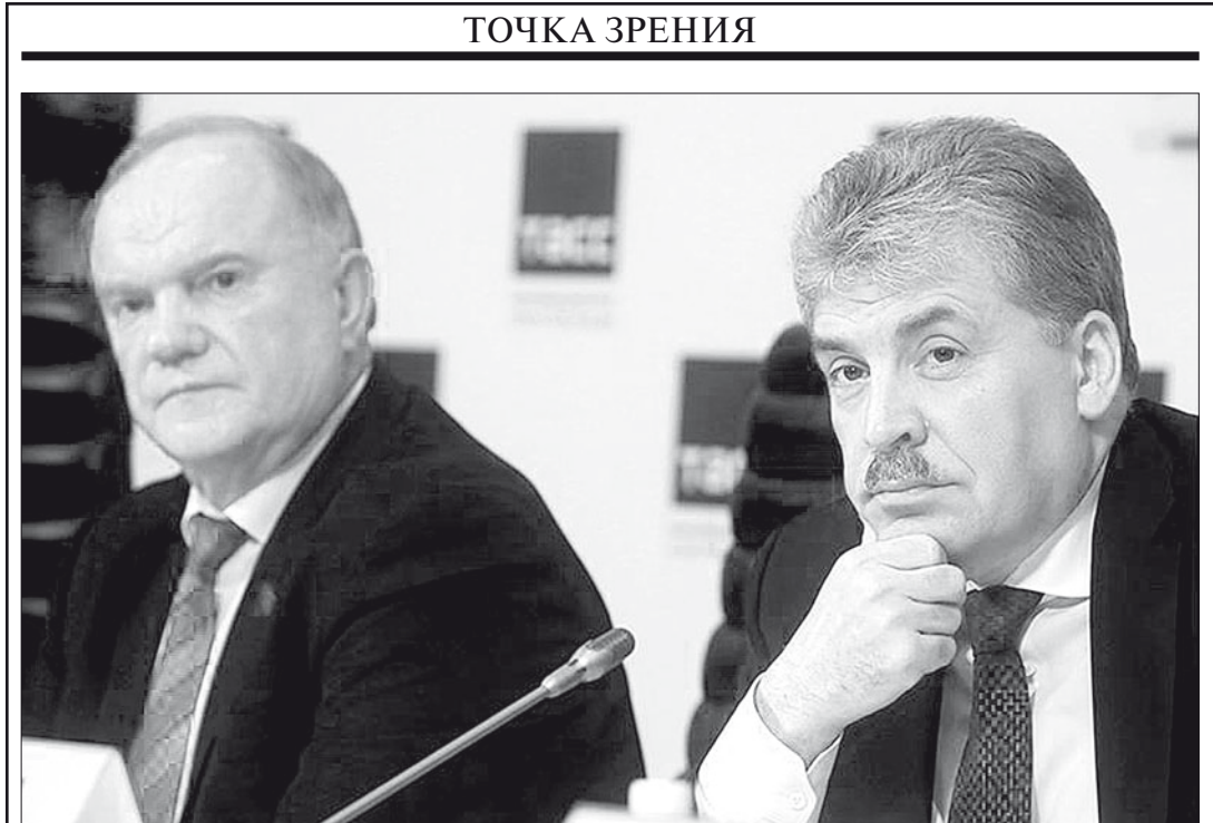
Внимательный читатель, видимо, помнит, что в своей статье «Скоро выборы, а на левом фланге тишина» (№49 от 14 декабря 2017 г.) я говорил о необходимости выдвижения на президентских выборах новых людей, более молодых и перспективных. В частности, как вариант в качестве кандидата в президенты назывался общественный деятель, хозяйственник, патриот П. Грудинин.