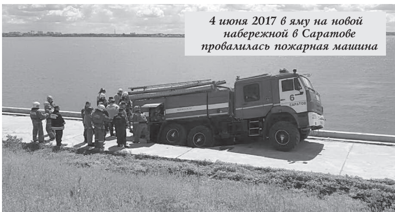
4 июня 2017 в яму на новой набережной в Саратове провалилась пожарная машина

Чтобы составить представление о нашем дорожном полотне, достаточно купить машину. Ещё можно почитать местные новости. За минувший год жертвами некачественного асфальтового покрытия и халатности дорожных и коммунальных служб стали несколько десятков машин и водителей.