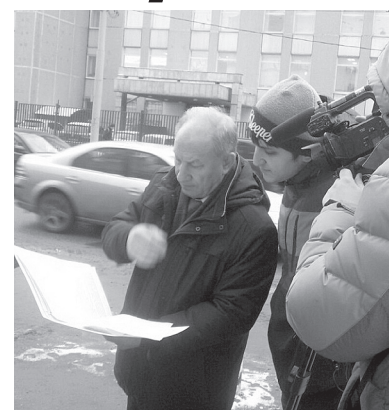
пиадой-2018 не дали ход: Савеловский районный суд Москвы отказался принять его к рассмотрению, пишет «Газета.Ru» со ссылкой на пресс-службу суда.

Удар по престижу нашей страны нанесен огромный. Что делать? Есть следующий вариант: упал — отжался!