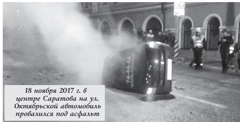
18 ноября 2017 г. в центре Саратова на ул. Октябрьской автомобиль провалился под асфальт

Осень. У Сенного рынка в схватке с автомобилем, гружённым асфальтом, побеждает яма. На Чернышевского в дорожный плен попал очередной автомобиль — жители местных домов предупреждали власти о таком исходе событий, но к ним не прислушались. На Московской/Октябрьской случился провал года — такси перевернуто на