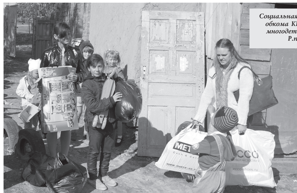
Социальная поддержка от Саратовского обкома КПРФ: подарки коммунистов многодетной семье и детскому саду. Р.п. Лысье горы, 2017 г.