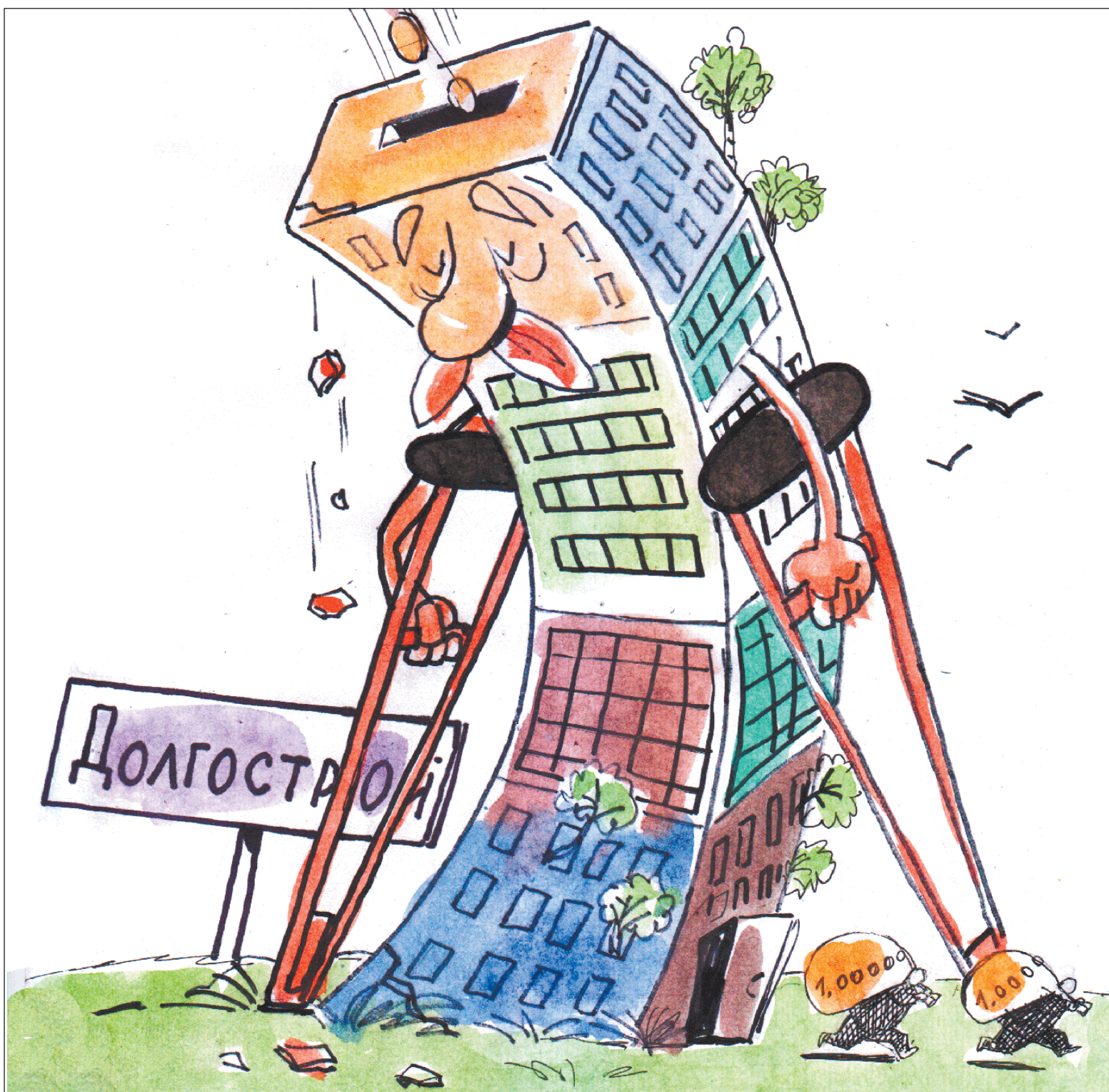
Рисунок Вячеслава Полухина.