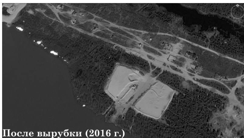
После вырубки (2016 г.)

Для каких целей это было сделано? Что выигрывает