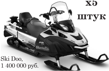
Ski Doo, 1 400 000 руб.