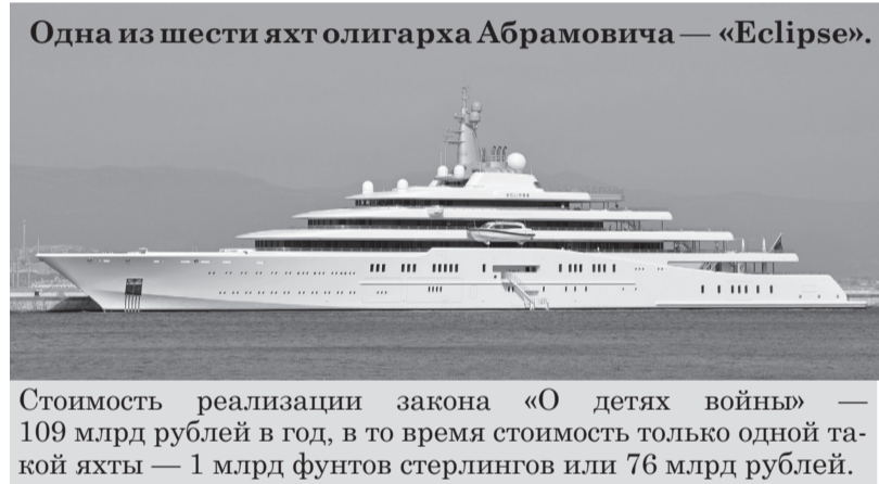
Одна из шести яхт олигарха Абрамовича — «Eclipse». Стоимость реализации закона «О детях войны» — 109 млрд рублей в год, в то время стоимость только одной такой яхты — 1 млрд фунтов стерлингов или 76 млрд рублей.