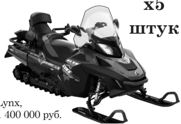
Lynx, 1 400 000 руб.