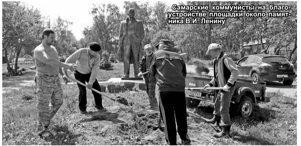
Самарские коммунисты на благоустройстве площадки около памятника В.И. Ленину