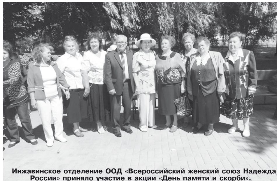
Инжавинское отделение ООД «Всероссийский женский союз Надежда России» приняло участие в акции «День памяти и скорби».

УЧРЕДИТЕЛЬ, ИЗДАТЕЛЬ: Тамбовское областное отделение политической партии «Коммунистическая партия Российской Федерации», АДРЕС: г. Тамбов, ул. 3 Линия, д. 18, к. 502, тел. 56-43-25