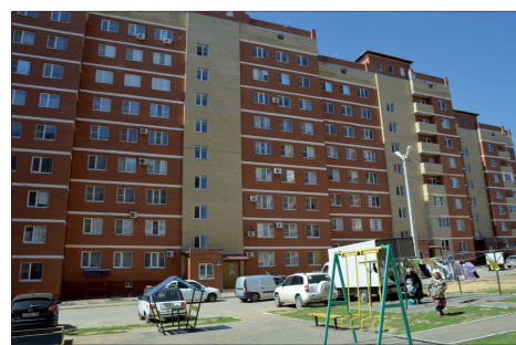
ЧТО СКРЫВАЕТ КРАСИВЫЙ ФАСАД? .. с. 7