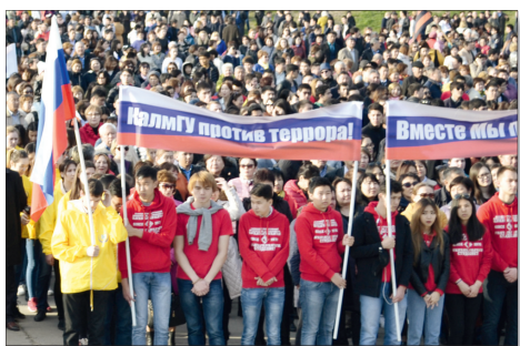
ВМЕСТЕ ПРОТИВ ТЕРРОРА .....с. 2

Газета Комитета Калмыцкого республиканского отделения политической партии КПРФ - kprf08.ru