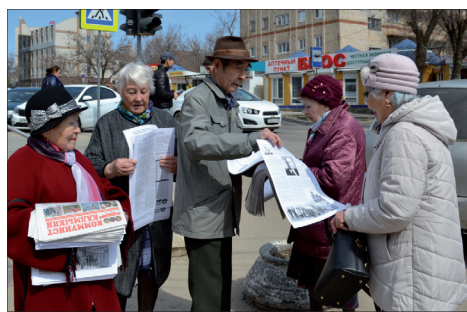
ПРОТИВ УХУЖДЕНИЯ ЖИЗНИ ..... с. 5