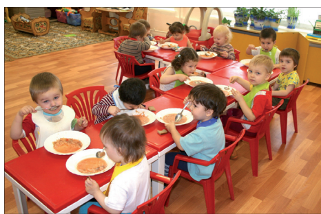
СГУЩЁНКА ДЛЯ ГРЕЧНЕВОЙ КАШИ ..... с. 3