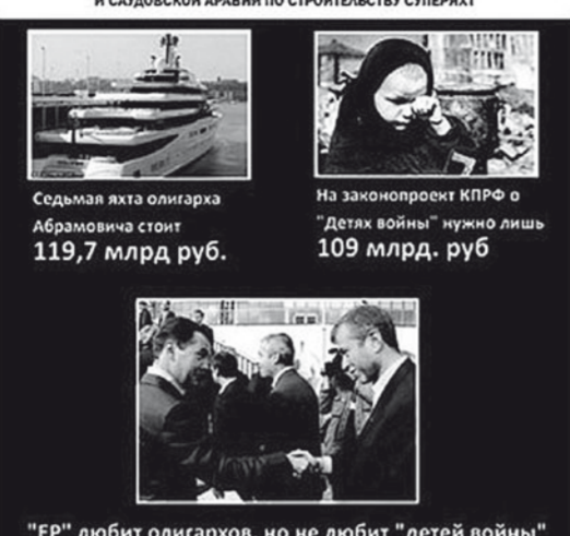
«ЕР» любит олигархов, но не любит «детей войны»

Очень непросто выживать в нынешнем «светлом» настоящем, господа. Вы утверждаете, что размер пенсий по сравнению с доперестроечным периодом вырос в 100 раз. Но при этом умалчиваете, что стоимость общественного транспорта, услуг ЖКХ увеличилась в 500-800 раз. Лекарства подорожали в сотни раз. Многие медицинские услуги платные. А продукты питания? Молоко стало стоить 50-60 рублей — в 300 раз дороже, чем в СССР. Масло превратилось в белково-растительный суррогат. И так почти всё.