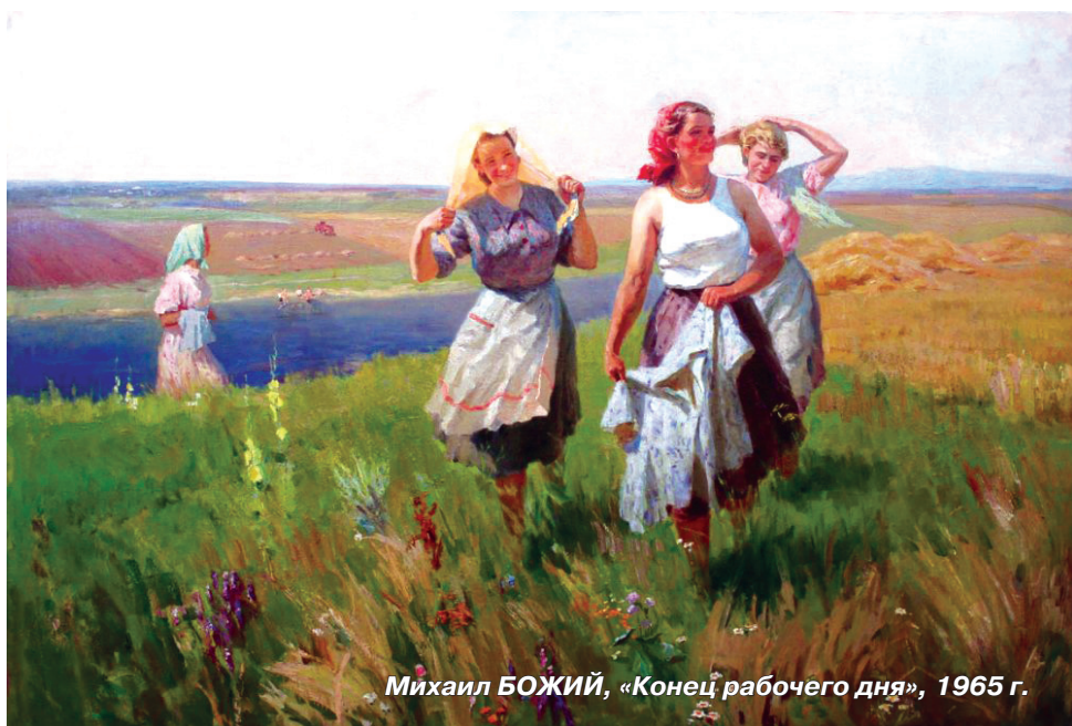
Михаил БОЖИЙ, «Конец рабочего дня», 1965 г.