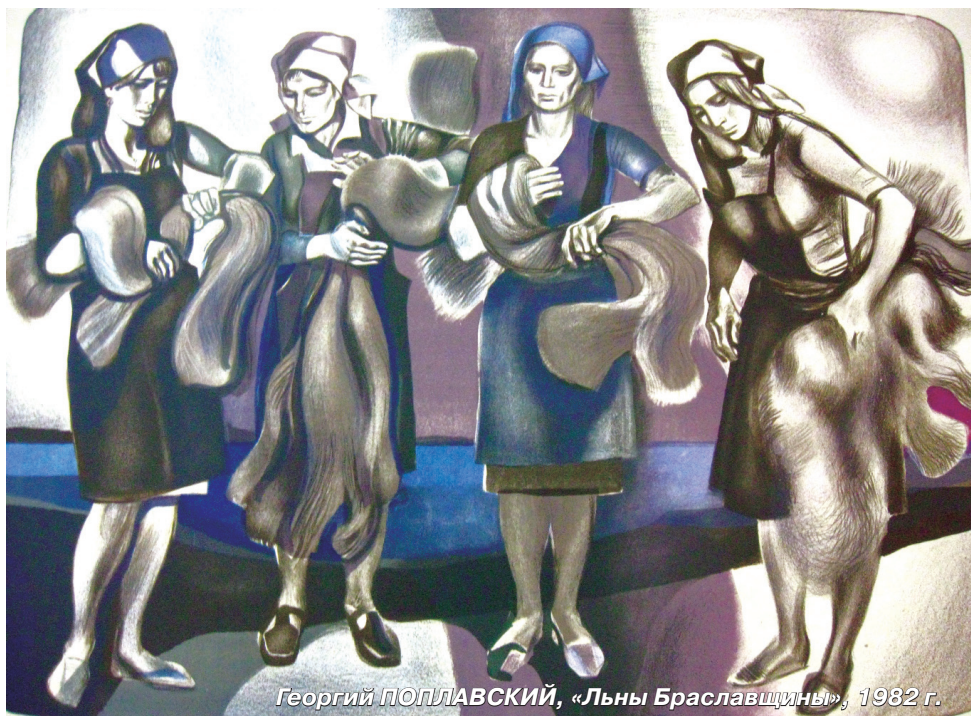
Георгий ПОПЛАВСКИЙ, «Льны Браславщины», 1982 г.