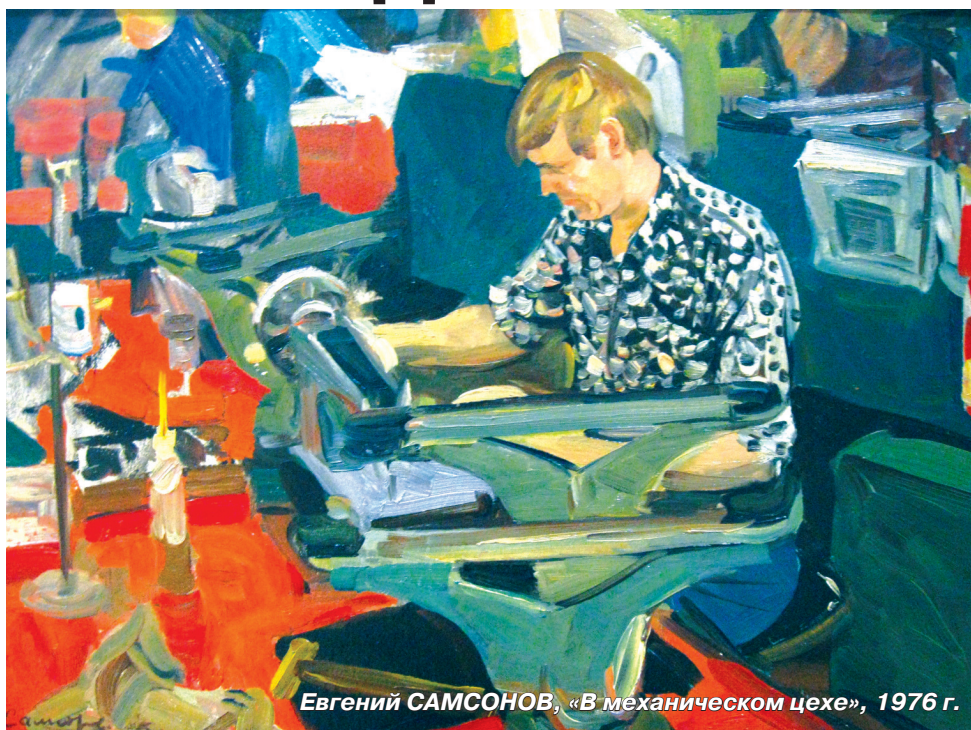
Евгений САМСОНОВ, «В механическом цехе», 1976 г.