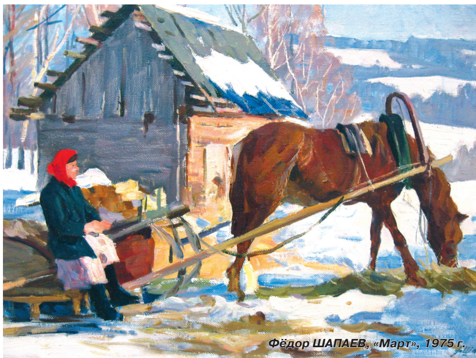
Фёдор ШАПАЕВ, «Март», 1975 г.

Под таким названием открылась выставка работ советских художников в областном центре пропаганды изобразительного искусства. На ней представлено более 100 произведений известных живописцев из коллекции Фонда развития искусств и образования (г. Москва). Среди участников – десять народных художников СССР и академиков Академии художеств СССР, а также лауреаты Государственной премии СССР.