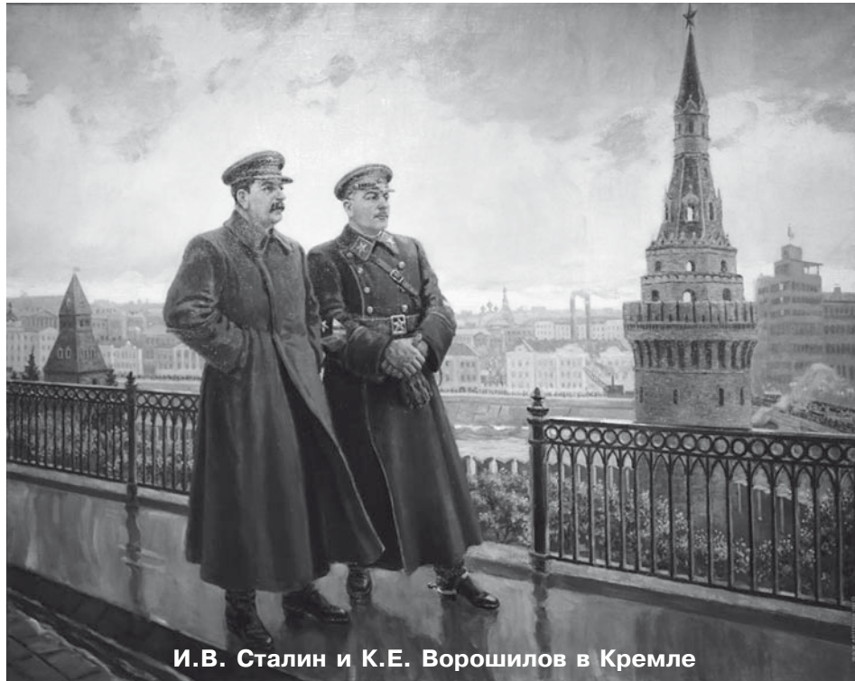
И.В. Сталин и К.Е. Ворошилов в Кремле

«Выстрел в народ» – это эпохальная картина, шедевр исторической действительности России, когда с приходом к