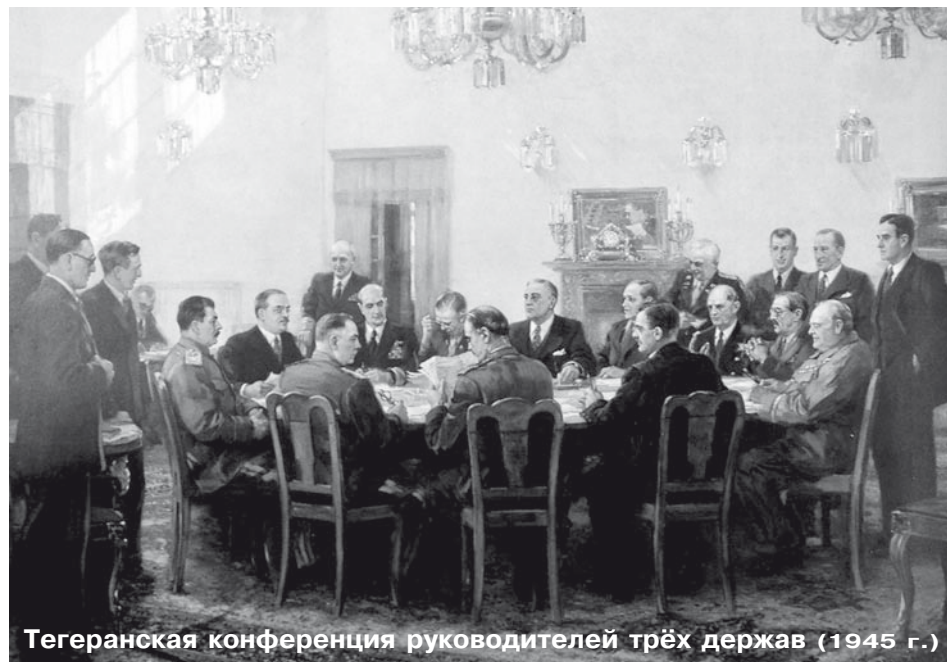
Тегеранская конференция руководителей трёх держав (1945 г.)

Его творчество не имеет временных границ. Моему сердцу, как и всем мичуринцам, дороги картины родного края: «И.В. Мичурин в весеннем яблоневом саду», «После дождя. Мокрая терраса», «Яблоневый сад», «Сад в цвету» и другие.