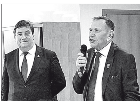
дателя секретаря ЦК КПРФ Г. А. Зюганова по случаю дня рождения комсомола.