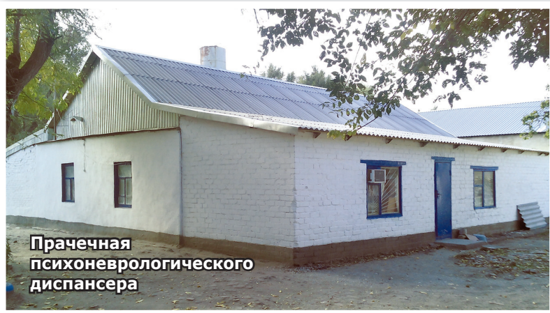
Прачечная психоневрологического диспансера