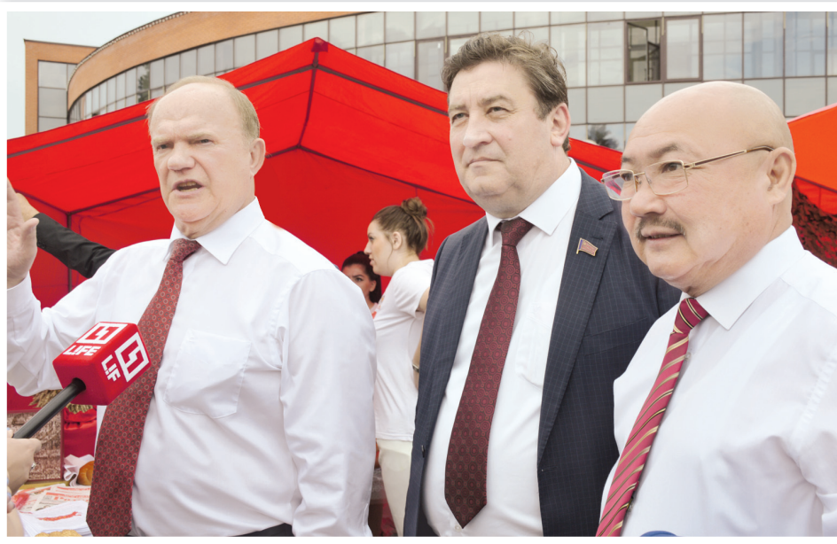
Делегаты предвыборного съезда КПРФ

оппозиционно настроенных избирателей и ссыпать их в карман «Единой России».