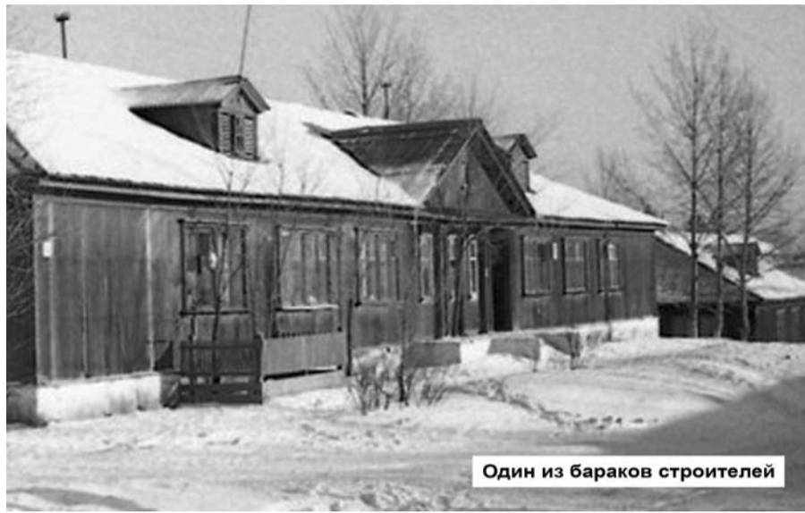
Один из барачников строителей

Цыган ловко соскочил с лошади, степенно подошел к мужикам, поздоровался с каждым за руку. Присел рядом на чурбак, вынул кисет с ароматным табаком, угостив им мужиков, затем стал набивать им свой вишневым чубук. Мужики закурили, повели с бароном непринужденный разговор, как старые приятели, будто были с ним давно знакомы. Минут через двадцать показался еще десяток лошадей, спускавшихся с горы, на которых сидели пять или шесть молодых, ведущих под уздцы оставшихся лошадей. Это были молодые ребята-цыгане лет двадца-