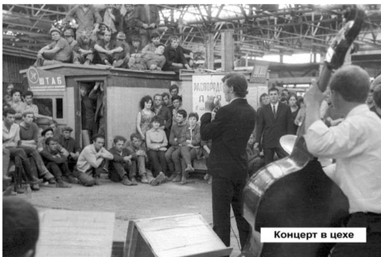
Концерт в цехе

И гуляют ветра по задворкам и свалкам, Чужа падаль, над ними кружит воронья, Лишь одна нищета станет внукам подарком, И в тревоге сердца – и твое, и мое.