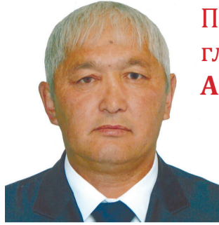
Уважаемые жители с. Кош-Агач!

С 01.08.2016 г. - начальник отдела контроля, связей с общественностью и вопросам приграничного сотрудничества.