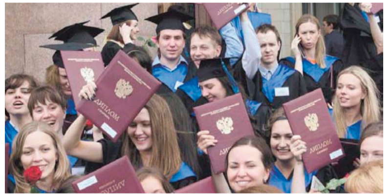
На фото: пригодится ли им диплом в дальнейшей жизни?