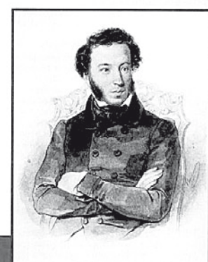
«Наш дом – Кавказ, наше Отечество – Россия»

V-го межрегионального фестиваля «ПУШКИНСКИЕ ДНИ НА СЕВЕРНОМ КАВКАЗЕ»