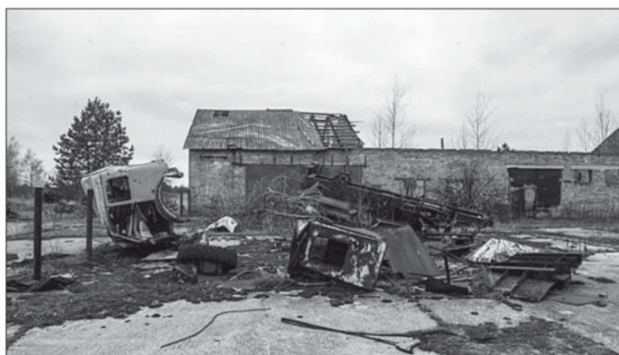
А так они закончились