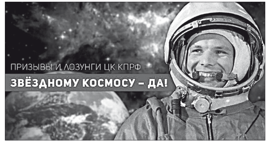
ПРИЗЫВЫ И ЛОЗУНГИ ЦК КПРФ ЗВЁЗДНОМУ КОСМОСУ – ДА!