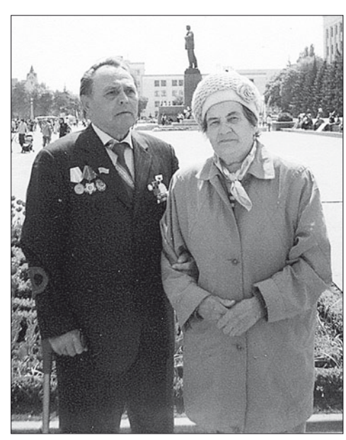
«Я жил среди этих людей, постигая их образ мысли, черпал из кладовой народной мудрости глубину и юмор, присущий русскому народу. Мои книги - напоминание о прожитой жизни, возвращение к истокам, к истории наших земляков»