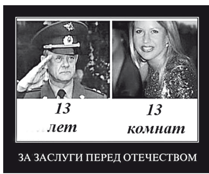
ЗА ЗАСЛУГИ ПЕРЕД ОТЕЧЕСТВОМ

правления Ельцина и его наследников, с момента развала Союза дали власти колоссальный аванс доверия.