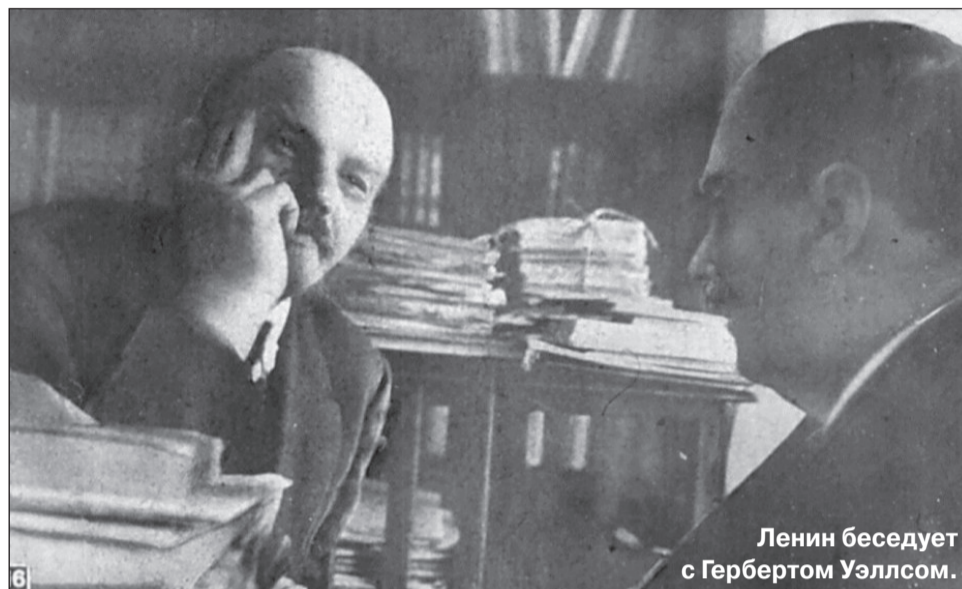
Ленин беседует с Гербертом Уэллсом.

эта грандиозная задача. Но первоходом стала Россия — под ленинским руководством.