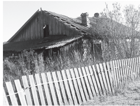
Дом по улице Строителей, №8