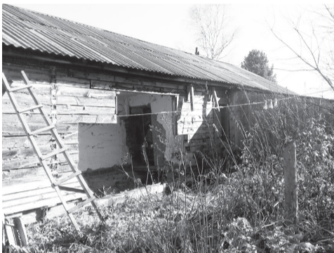
Вид со двора барака №9 по ул. Строителей, кв. №2