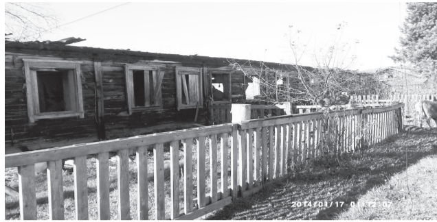
ул. Строителей, сгоревший барак №7