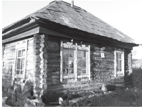
Переулок Больничный, дом №3

13 февраля 2015 года в Каракокше сгорел барак. Сгорело имущество жильцов. Не смотря на то что на крыше было много снега, барак сгорел мгновенно. Одно слово старье. Обвинили одного из жильцов. Барак не оформлен