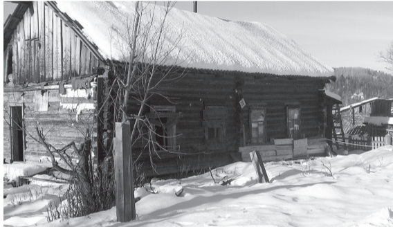
Дом по улице Строителей, №25

депутат Каракокшинского сельского поселения