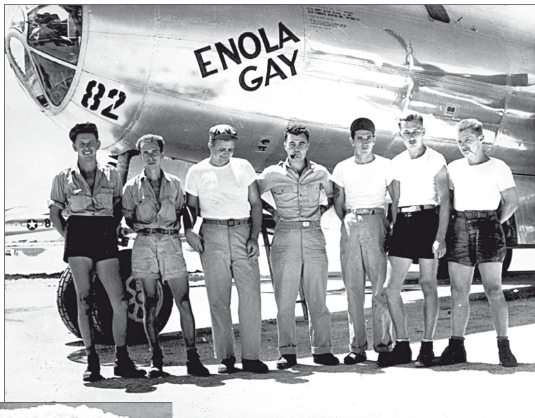
Экипаж самолёта В-29 перед вылетом для бомбардировки Хиросимы. Милые ребята, не так ли? Следующими могли стать мы. Уже были запланированы и ядерные удары по 20 городам СССР...

«Мы» – это Россия, точнее – Советский Союз. «Они» – США. Как известно, история открыта для самых разных сценариев. Никто не может гарантировать, что она сложится счастливо. Выскажем оптимистическое предположение, что здравый смысл победит и будущее человечества, достаточно комфортное, всё же состоится. Возникает любопытный вопрос: что главное будут помнить люди будущего из прошлой Америки (США) и России (советской)?