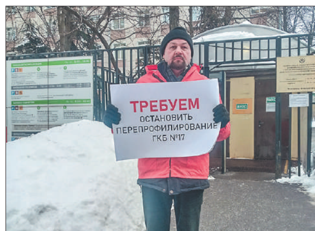
Стр. 6 – ГКБ № 17: спасти нельзя оптимизировать