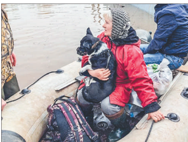
Стр. 4 – Перед лицом стихии