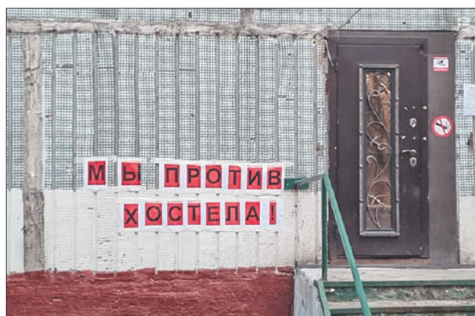
Стр. 2 – В нашем доме поселился «замечательный» сосед